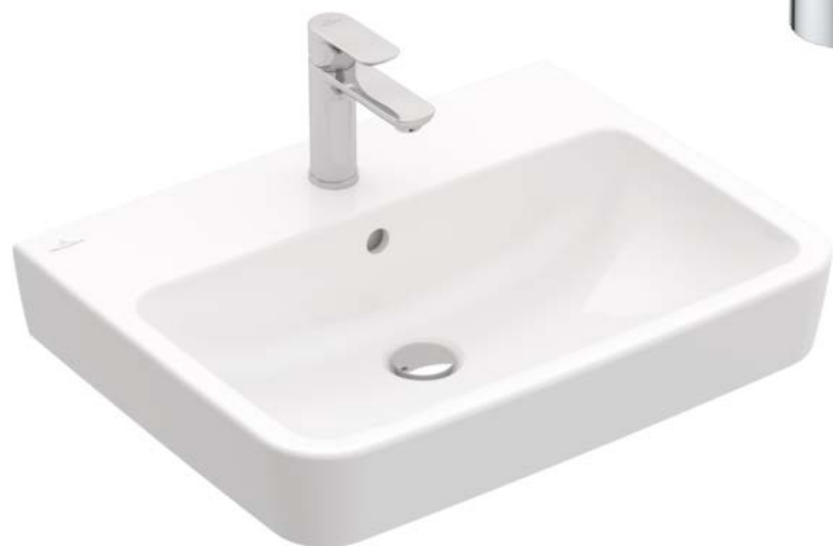
Umývatko Villeroy & Boch O. Novo 36 x 25 cm