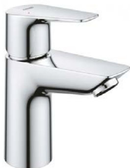
Baterie Grohe BauEdge páková chrom s push-up odtokovou soupravou