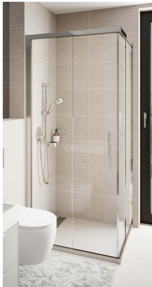
Sprchový kout Elba se sprchovou zástěnou chrom/sklo 90 s odtokovým žlabem