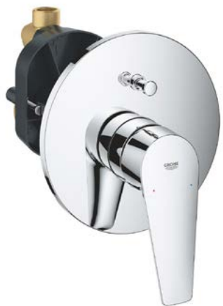
Podomítková baterie Grohe Bauedge chrom