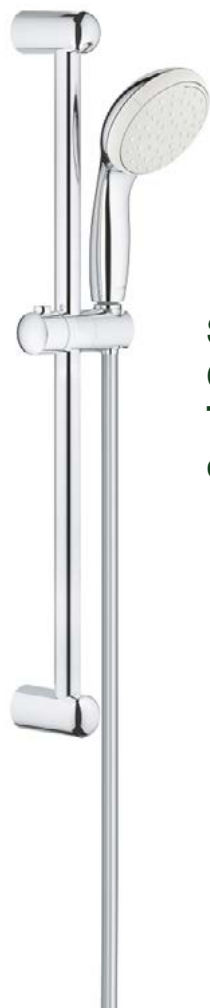
Sprchový set Grohe New Tempesta chrom