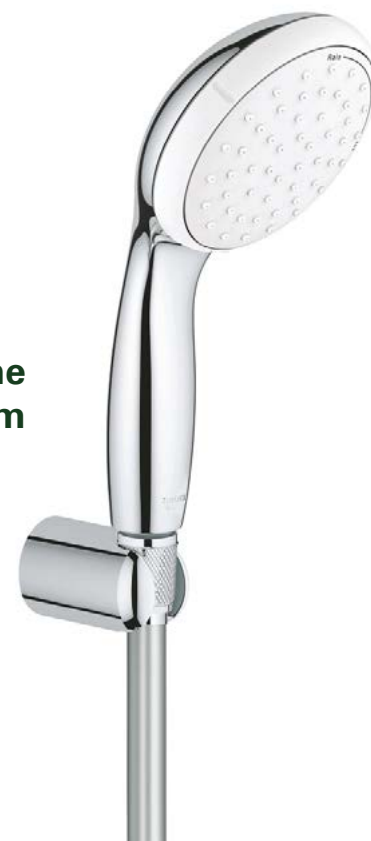
Sprchový set Grohe New Tempesta chrom