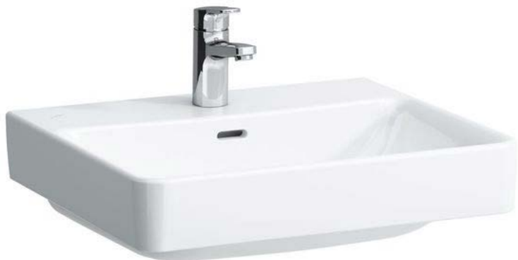
Umývatko Villeroy & Boch O. Novo 36 x 25 cm