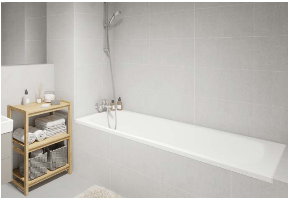
Vana Kaldewei Eurowa bílá 170 x 70 cm