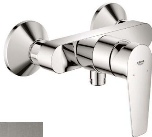
Baterie Grohe Bau Edge páková chrom