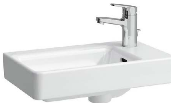
Umývatko Villeroy & Boch O. Novo 36 x 25 cm